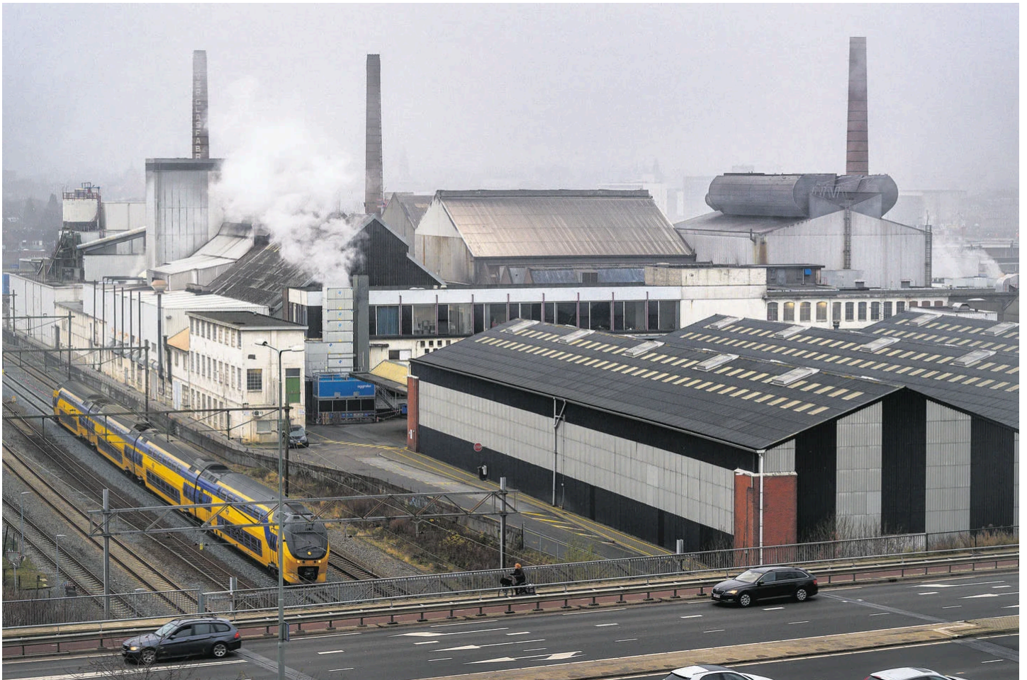
Glasfabriek O-I.

Het tweede gebied waar Maastricht op aast, is O-I, aan de overkant van de Noorderbrug. De Amerikaanse eigenaar besloot op 1 oktober om de glasfabriek te gaan sluiten, wat ruim 200 mensen hun baan kost. Als O-I het terrein wil verkopen, kan dat nu niet meer buiten de gemeente om. Gezien de ligging kan dit gebied aansluiten op de geplande woningbouw bij het station. De Nederlandse O-I-directie was niet bereikbaar voor commentaar.