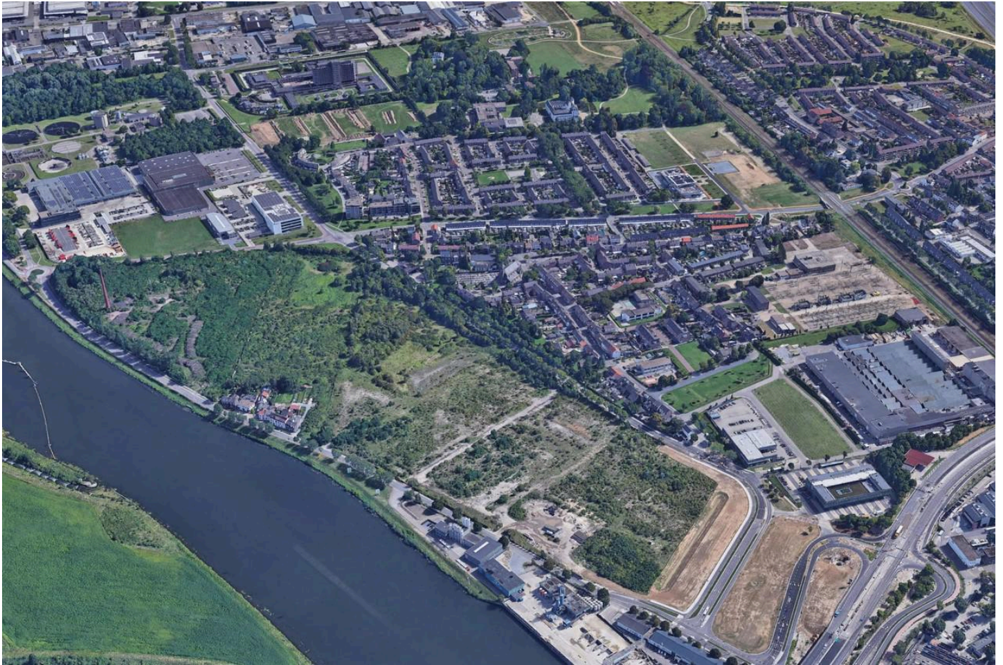
Het gebied aan de Maas waar de nieuwe woonwijk moet komen. Onderin het Dolmanskwartier.

Maar er gloort meer hoop. Het tankstation aan de Willem Alexanderweg verdwijnt. Bovendien bezit de gemeente aan de overkant van het Julianakanaal vijf hectare grond, bestaande uit een populierenbos en landbouwgrond. „Door die braak te laten liggen, bespaar je veel stikstof. Samen kunnen deze twee maatregelen 500 extra woningen opleveren”, schat projectleider Kruchten.