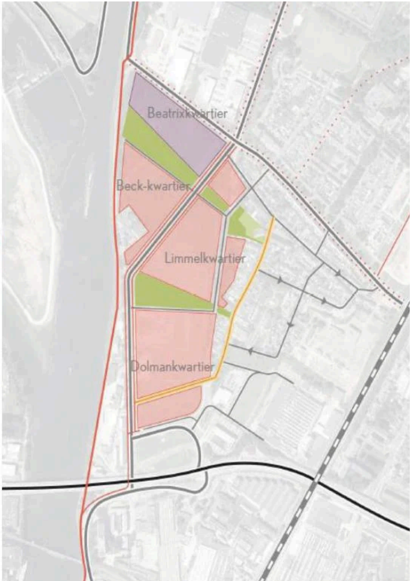
De vier kwartieren van Limmel aan de Maas.