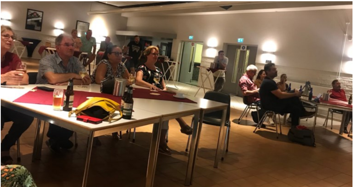
Wijkbewoners keken in het Kapelaan Lochtmanhuis naar de beelden van de raadsvergadering.