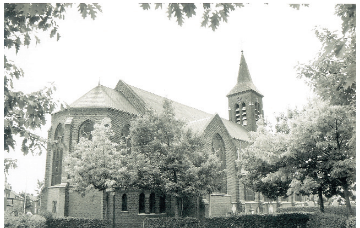
De Sint-Jan-de-Doperkerk van Limmel, 1998.